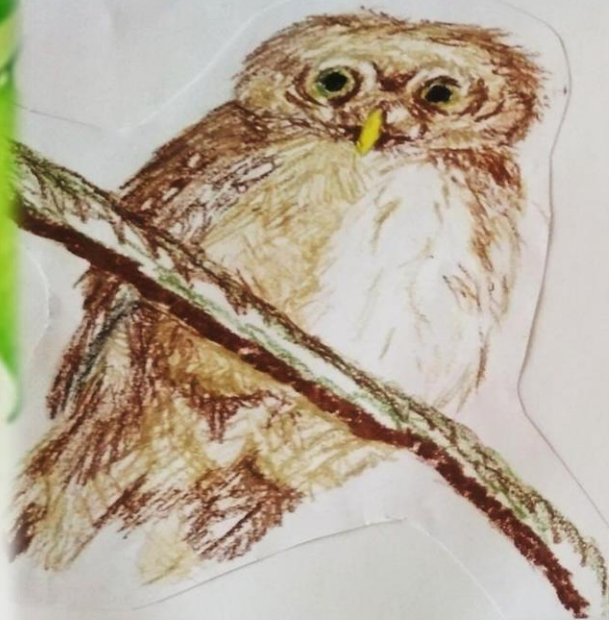
Sóweczka zwyczajna ( Glaucidium passerinum )

Ochrona - ptaki te są chronione gatunkowo. Całoroczna strefa ochronna od gniazda jest w rezerwacie przyrody w rejonie Czerwonej Księżki.