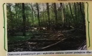
Obecność powalonych pni i wykrotów ułatwia ryśowi podjęcie ofiary.

Ryś poluje przede wszystkim na samce. Poluje także na łanie i młode jelenie, ale czynią to rzadziej. Poluje także na mniejsze zwierzęta: liane płaki, np. jarebki czy ciętrzewie, jak również małe ssaki - zające czy nawet gzyzanie. Ryś poluje najczęściej od zmroku do wschodu słońca. W czasie polowania skradają się, wykorzystując naturalne zasłony np. zwalone drzewa, kępy czy kępy traw. Ryś poluje także na zwierzęta, które są dla niego łatwiej dostępne, np. zwalone drzewa, kępy czy kępy traw. Ryś poluje także na zwierzęta, które są dla niego łatwiej dostępne, np. zwalone drzewa, kępy czy kępy traw.