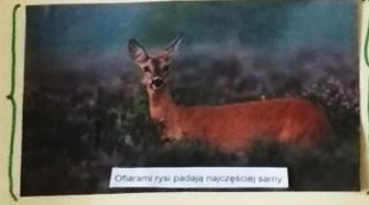
Ofiarą ryśa padają najczęściej samce.