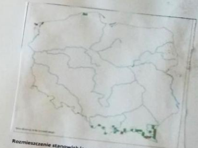
Rozmieszczenie stanowisk lęgowych orła przedniego w roku 2019 (czerwone - więcej niż 1 para, zielone - 1 para, obrys - brak stwierdzeń)