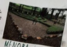
MENORA - symbol światła i wiedzy