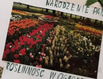
ROSLINNOŚĆ W OGRODZIE