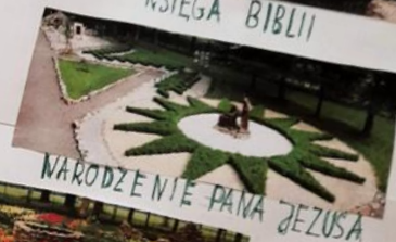
NARODZENIE PANA JEZUSA