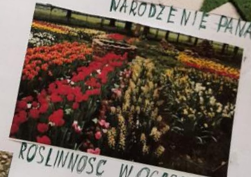
ROSLINNOŚĆ W OGRODZIE