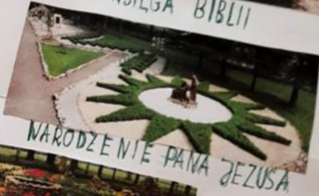
NARODZENIE PANA JEZUSA