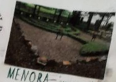
MENORA - symbolizuje światłość i sprawiedliwość